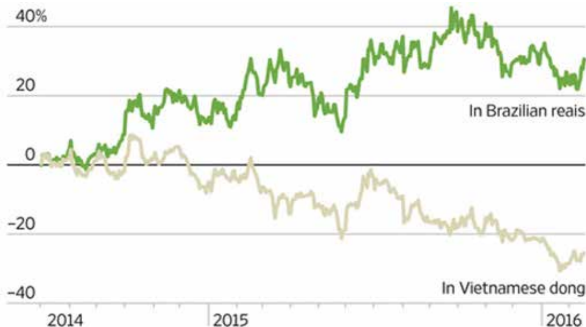
Figura 1 – Variação do preço futuro do café robusta em Real e Dong. Fonte: The Wall Street Journal (2016).

No Brasil, com a forte desvalorização do Real, os preços pagos ao produtor aumentaram ao longo de 2015, fato discutido no v.5 n.1 deste relatório. O WSJ destaca a elevação das exportações do conilon brasileiro de 21%, em comparação com 2014, graças ao aumento da competitividade diante do robusta vietnamita. Um cafeicultor de conilon do Espírito Santo, entrevistado pelo jornal, informou que estava renovando parte de sua lavoura e também a ampliando, já que os preços atuais são “sustentáveis”.